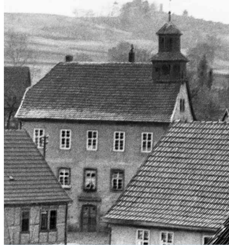
Das älteste Gebäude im Dorf ist das Dorfgemeinschaftshaus, ehemals Schule und Betsaal, erbaut als Zehntscheune („Finanzamt“) des Klosters Schlüchtern. Im Hintergrund die Bellinger Warte (Aufnahme um 1930).

Der Steinauer Stadtteil liegt im nordöstlichen Spessart, getrennt vom Kinzigtal durch den Bellinger Berg. Historisch gesehen befindet sich Bellings in einer Grenzlage. Hier trafen die frühmittelalterlichen Kulturräume des Saalegaus, der Wetterau und des Kinziggaus zusammen.