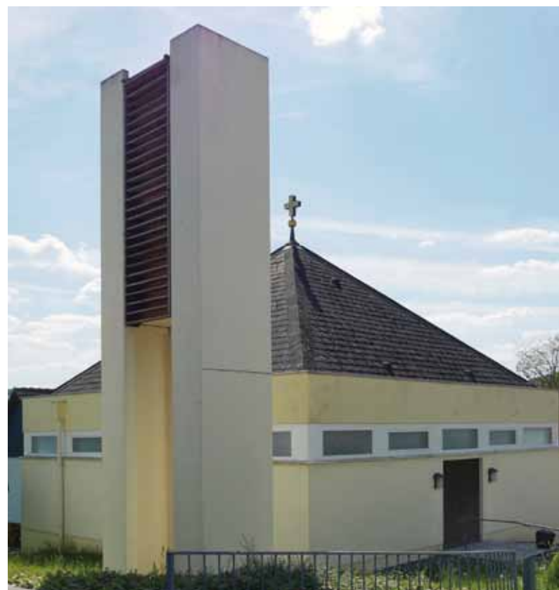
Die Elisabeth-Kirche Bellings gehört zur Evangelischen Kirchengemeinde Hohenzell-Ahlersbach-Bellings. Das Gebäude wurde 1970 erbaut und bei der Einweihung im Jahr 1971 nach der heiligen Elisabeth von Thüringen benannt.

„Mit Verlaub, sind Sie nicht ein Herr Grimm?“ „Ja“, antwortete ich. Da schüttelte er mir die Hand: „Was sind Sie unserem seligen Herrn Amtmann so ähnlich! Oh, ich habe die kleinen Kinder oft auf dem Arm im Hof herumgetragen, wenn wir Amtstag hatten! Mich können Sie nicht mehr kennen. Ich bin der Scholtheß von Bellings.“ Solche Auftritte sind mir öfter vorgekommen.