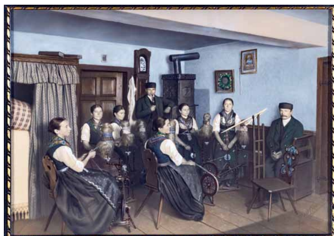
Das kolorierte Foto von Frauen und Männern in einer Bellinger Spinnstube aus dem Jahr 1911 zeigt den hohen Stellenwert, den eine solche Darstellung damals genoss. Es handelt sich um eine gestellte Aufnahme, für die eigens Tracht angelegt wurde. Die Erinnerung daran blieb lebendig bis zum 800-jährigen Dorfjubiläum 1967, bei dem ein Festwagen des Umzuges dieses Thema wieder aufnahm.