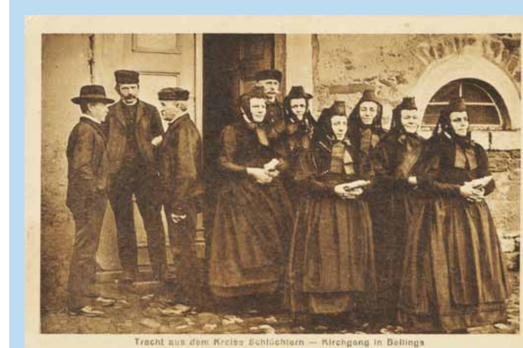
Im zweiten Stock des alten Schulhauses wurde 1837 der Betsaal eingerichtet. Es gab dort eine Kanzel, eine Orgel und Bänke. Die Aufnahme von 1910 zeigt die Betsaalbesucher nach dem Kirchgang vor dem Gebäude. Die Männer trugen Pelzkappen oder runde Filzhüte, die Frauen schwarze Bänderkappen. Eine Bellinger Frauentracht (rechts) befindet sich im Museum in Steinau.

Das Dorf gehörte zum Kloster Schlüchtern und damit bis zur Reformation zum Bistum Würzburg. Diese Verbindung nach Franken hat sich auch im Dialekt niedergeschlagen, der über einige Besonderheiten verfügt, die in das Frankenland weisen. Vom Dialekt erzählt das Buch „Bellinger Däudsch – Äbbes foo Bellings“. Über die Gemarkung des Bellinger Bergs und den Besitz einzelner Höfe übernahmen die Grafen von Hanau die Dorfherrschaft in Bellings als Nachfolger des Klosters Schlüchtern.