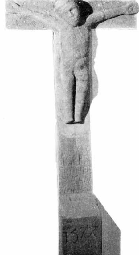
Das älteste Bellinger Kunstdenkmal ist ein Kruzifix aus dem Mittelalter, das in der Friedhofsmauer verbaut war und sich heute im Kreuzgang des ehemaligen Klosters Schlüchtern befindet. Die Inschrift auf dem Steinsockel lautet: DISER RC HOF HEIST ZU SANT MARGRETA 1574, doch Achtung: Der Sockel stand in der Mitte des Friedhofs. Erst bei der Aufstellung im Kloster wurden beide Teile verbunden.

Das Dorf gehörte zum Kloster Schlüchtern und damit bis zur Reformation zum Bistum Würzburg. Diese Verbindung nach Franken hat sich auch im Dialekt niedergeschlagen, der über einige Besonderheiten verfügt, die in das Frankenland weisen. Vom Dialekt erzählt das Buch „Bellinger Däudsch – Äbbes foo Bellings“. Über die Gemarkung des Bellinger Bergs und den Besitz einzelner Höfe übernahmen die Grafen von Hanau die Dorfherrschaft in Bellings als Nachfolger des Klosters Schlüchtern.