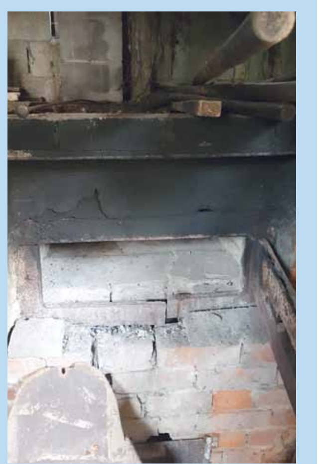
Auf dem heute noch landwirtschaftlich genutzten Areal ist ein traditioneller Backofen in Nutzung.

Die laufenden Einkünfte kamen aus dem Ackerbau, der Milchproduktion und dem Verkauf von Schweinen und Rindern. 2024 gab es in Bellings noch zwei Milchproduzenten und einen Haupterwerbslandwirt. Erhöht hat sich die Zahl der Nebenerwerbslandwirte.