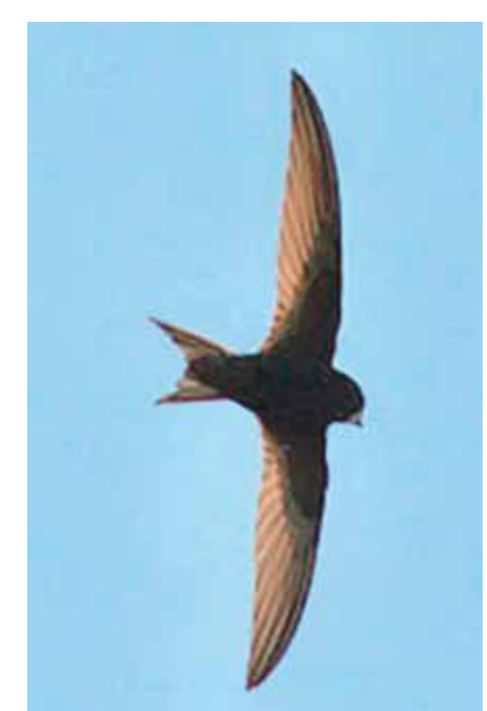
Das Dorfgemeinschaftshaus ist die Heimstatt von Mauerseglern, wo sie seit 1992 betreut und gefördert werden. Bei der Sanierung des Gebäudes wurden Nisthöhlen in den Wänden installiert. 2021 gab es 40 Nisthöhlen und -kästen, die von 21 Brutpaaren genutzt wurden.