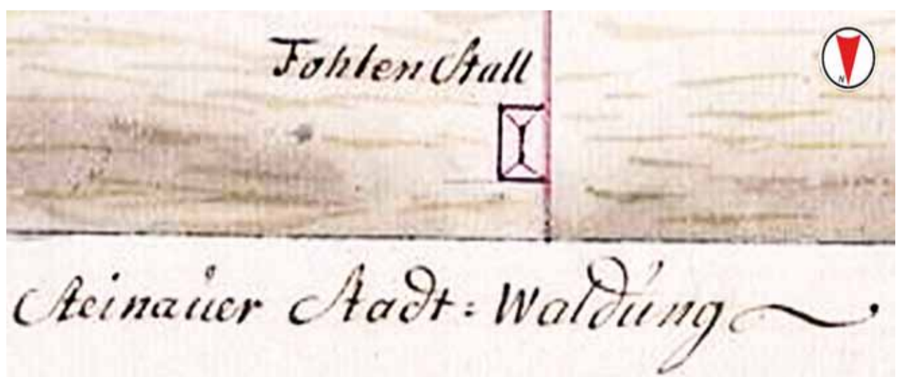
Der „Fohlenstall“ auf einer Karte von 1776

Die meisten Handwerker stammten aus Steinau. Ihre Nachnamen sind hier heute noch geläufig.